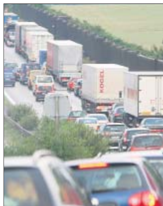
So könnte es bei der „Diesel-Demo“ aussehen.

Dennoch ist nicht ausgeschlossen, dass es am Samstagvormittag auf den drei für die Lastwagen-Sternfahrt nach Berg bei Hof genutzten Autobahnen A9, A72 und A93 zu Staus und